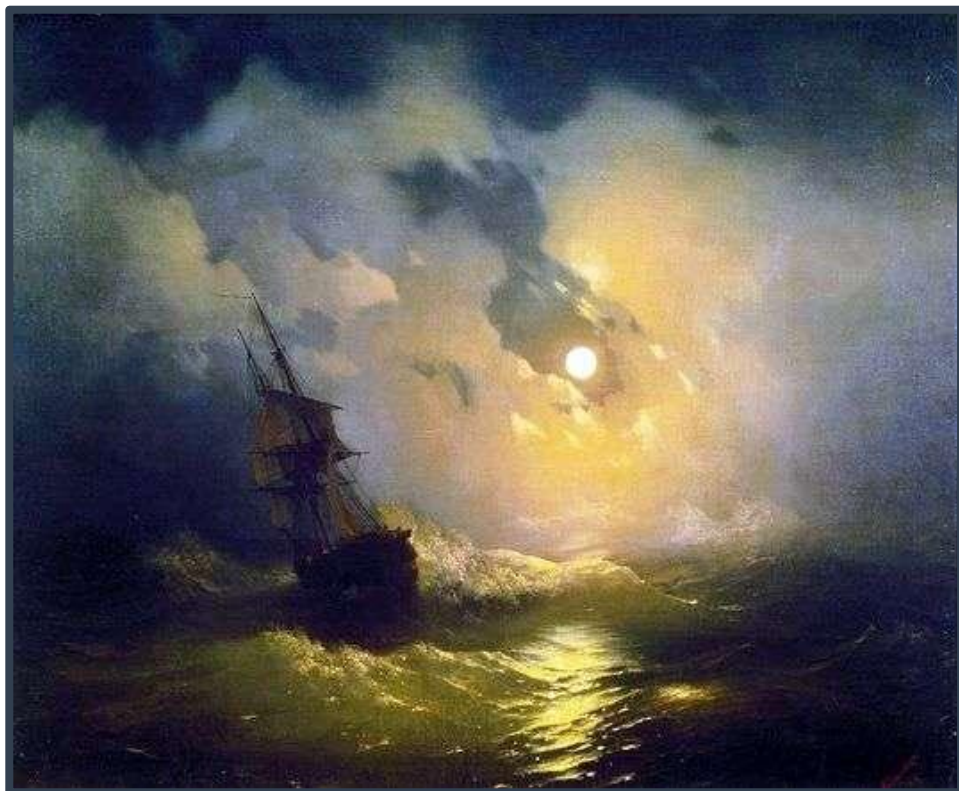
І. Айвазовський Буря на морі вночі

Вправа 2. Розглянь світлини картин, які зацікавили друзів. Зроби висновок, що малював Іван Айвазовський.