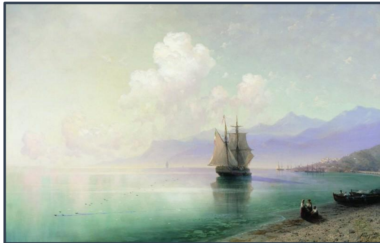
І. Айвазовський Штиль