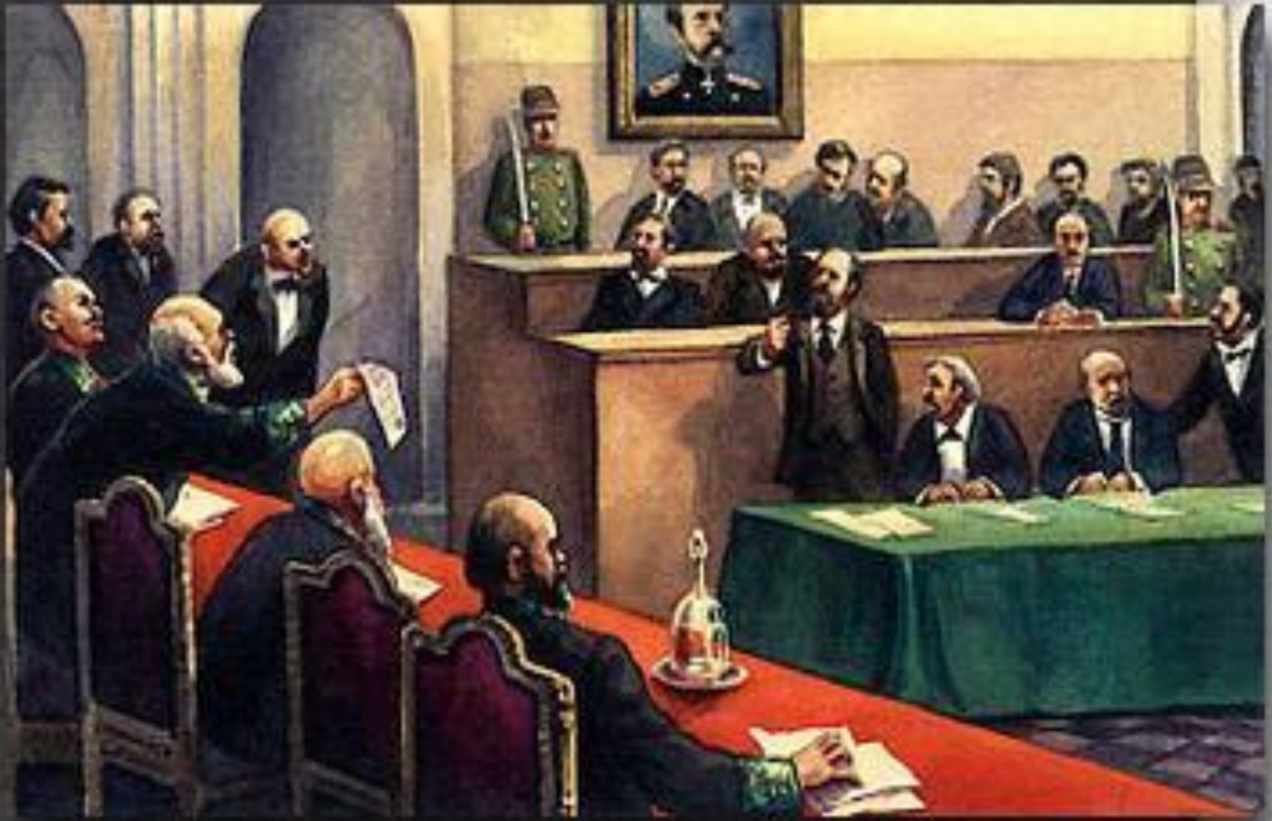
Заседание нового суда с присяжными заседателями