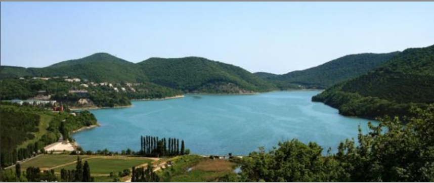
озеро Абрау, около г. Новороссийска

Кроме искусственных водоёмов в Краснодарском крае много естественных водоёмов. Это реки, пруды, озёра.