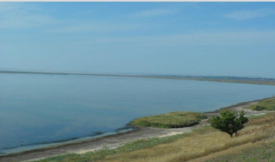
озеро Ханское около г. Ейска, у Азовского моря