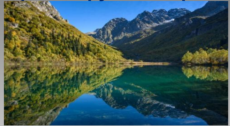
горное озеро Кардывач в г. Сочи