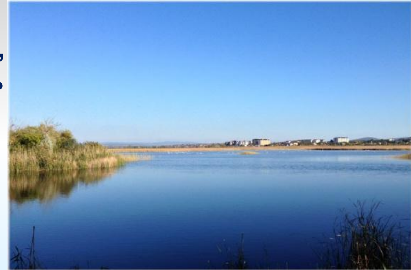
озеро Чембурское около г. Анапы

Они не только радуют людей своей красотой, но и лечат многие болезни, там есть целебные грязи.