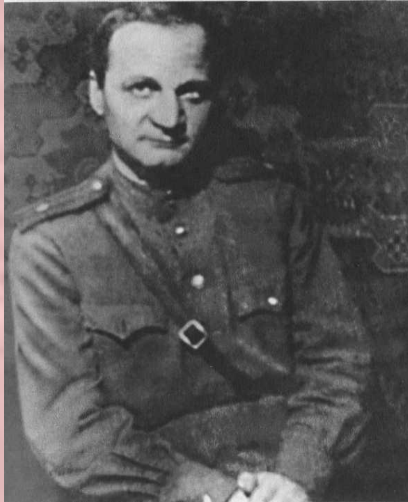
Платонов в 1943-1944гг.