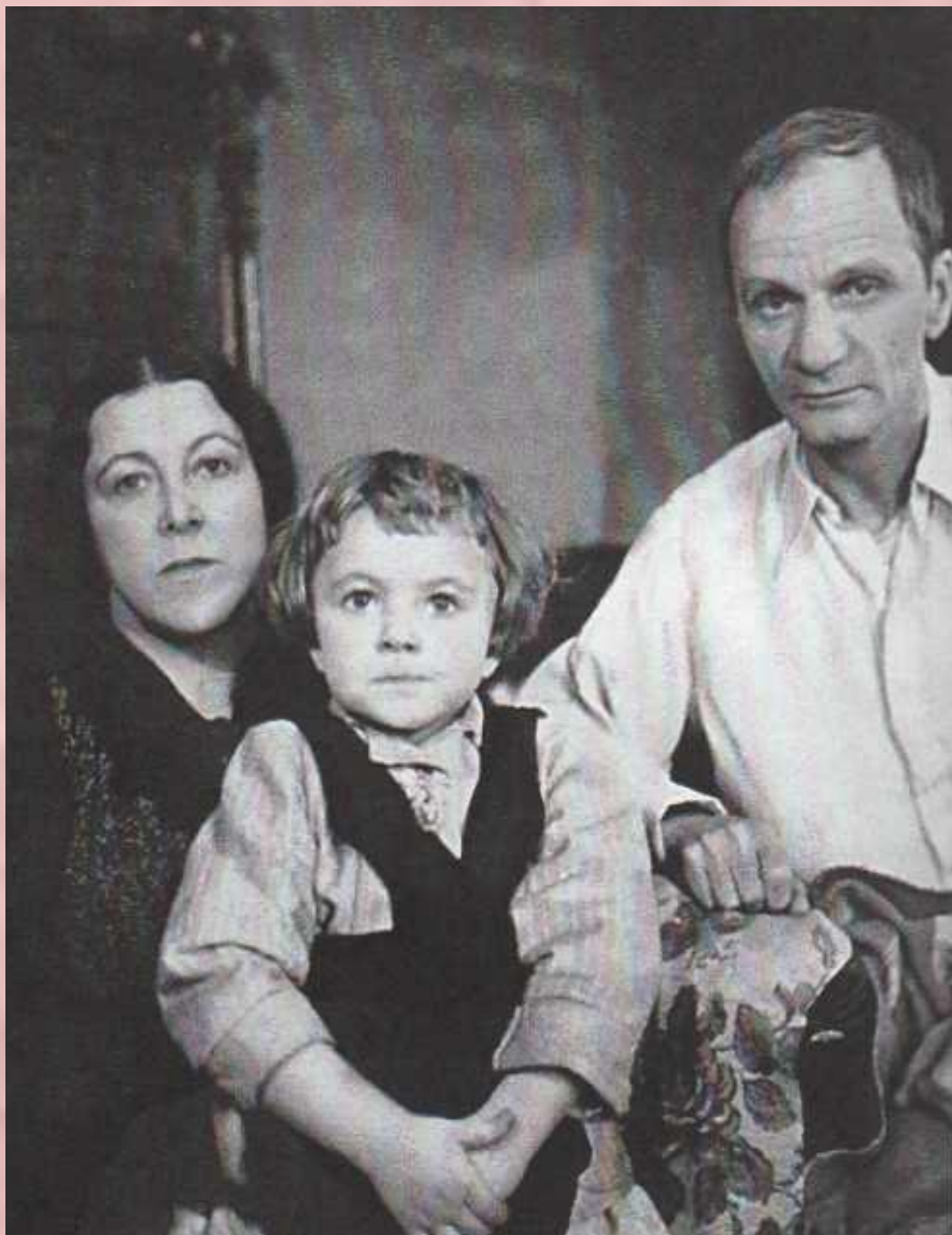
1951г. А.Платонов с женой и дочерью Машей.