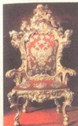
Тронево кресло императрицы Елизаветы Петровны