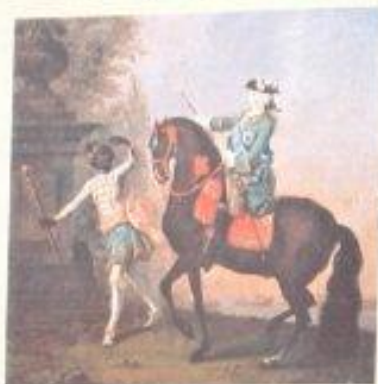
Императрица Елизавета Петровна на коне с прусским. Худ. Г. Грот