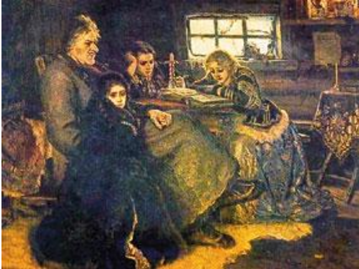
Меншиков в Борозово