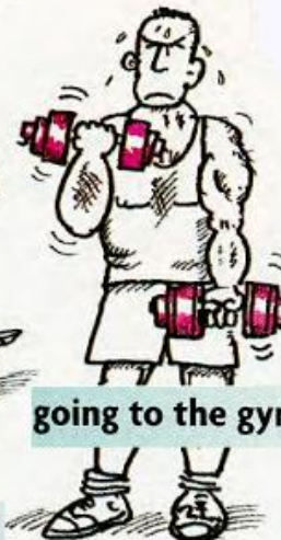
going to the gym