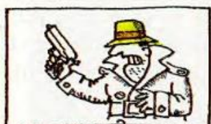
going to the cinema