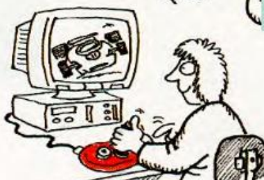
playing computer games