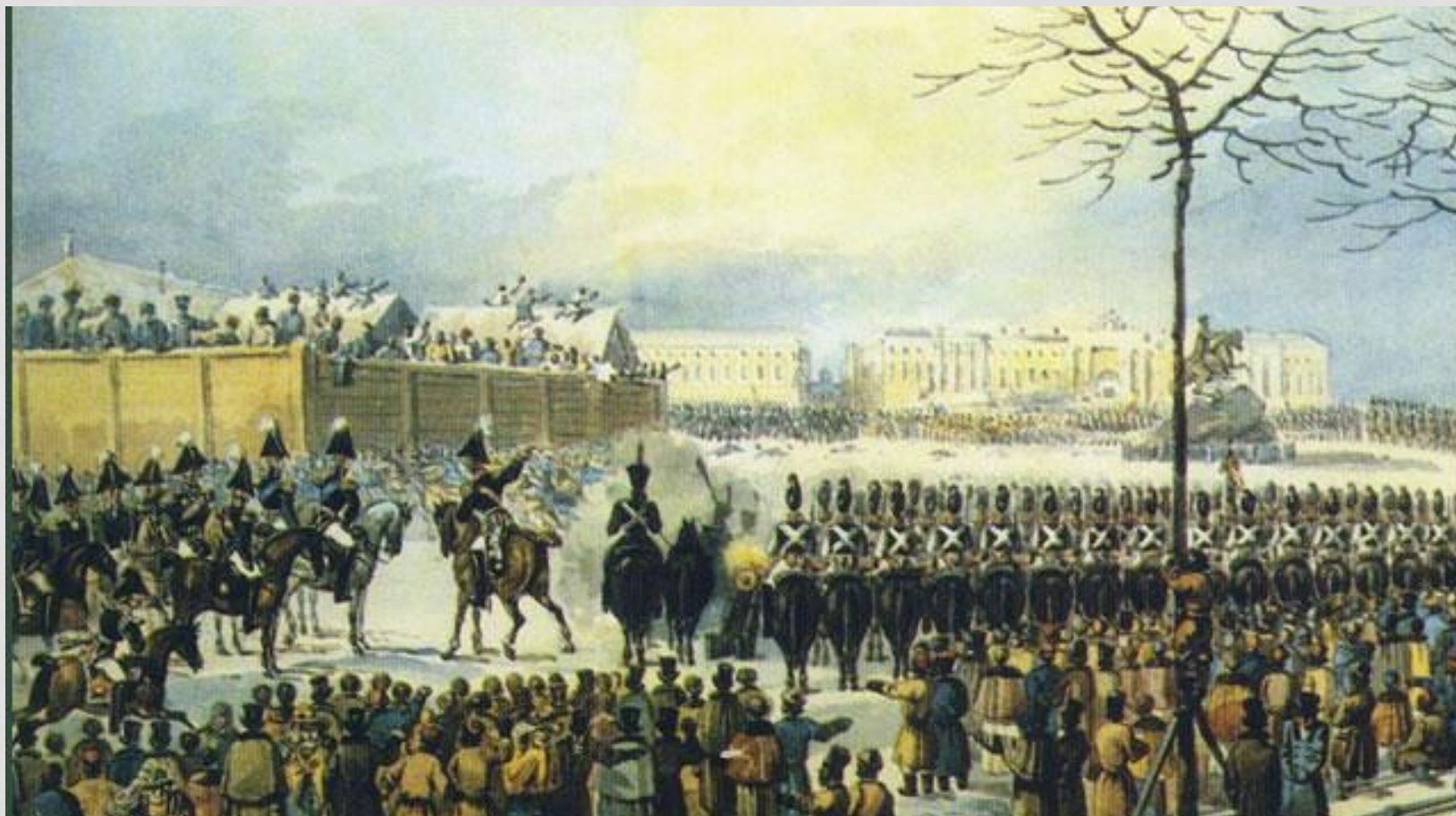
ВОССТАНИЕ ДЕКАБРИСТОВ 14 ДЕКАБРЯ 1825 ГОДА