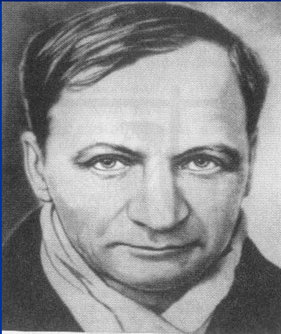
Андрей Платонович Платонов