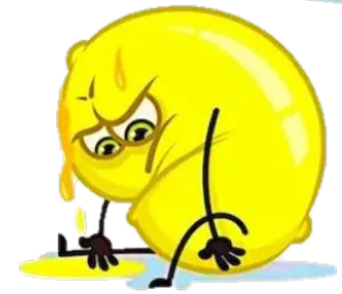
Я дуже втомився