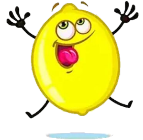
Все було легко та просто