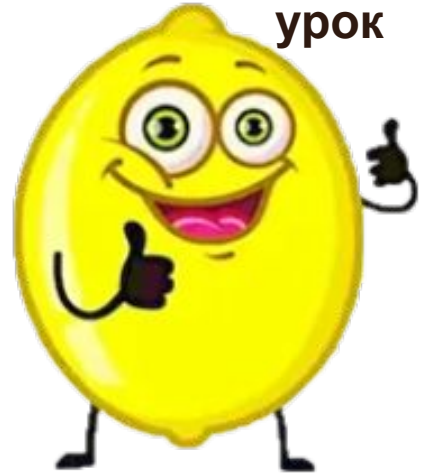
Більше сміху ніж навчання