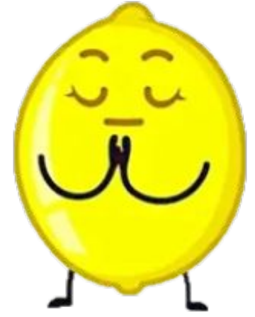
Чекаю на наступний урок