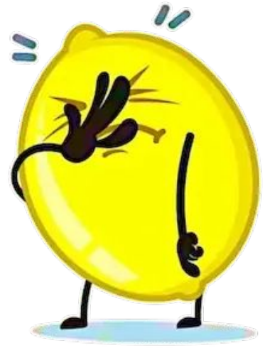
Мене урок розлютив