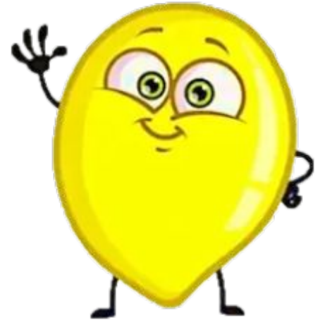
Я з усім упорався