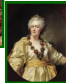
Екатерина II 1762-1796