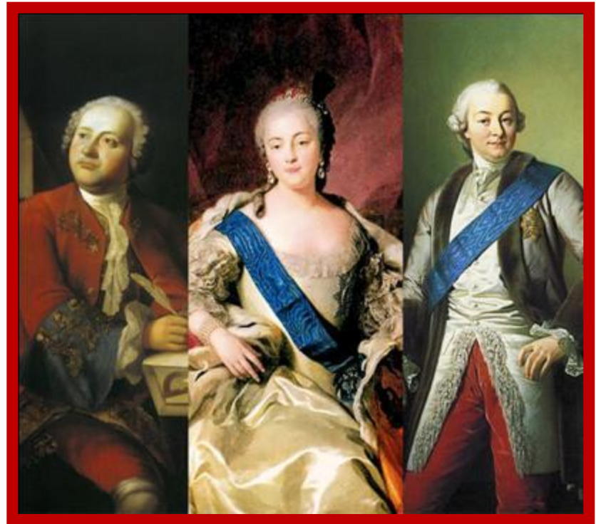
Михаил Васильевич Ломоносов, императрица Елизавета Петровна, Иван Иванович Шувалов.