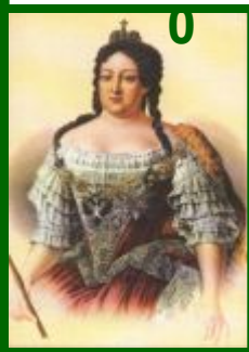
Анна Иоаннов на 1730-1740