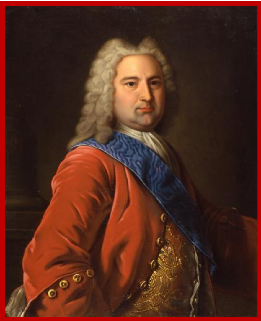
Эрнст Бирон – фаворит Анны Иоанновны