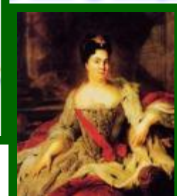
Екатери на I 1725-1727