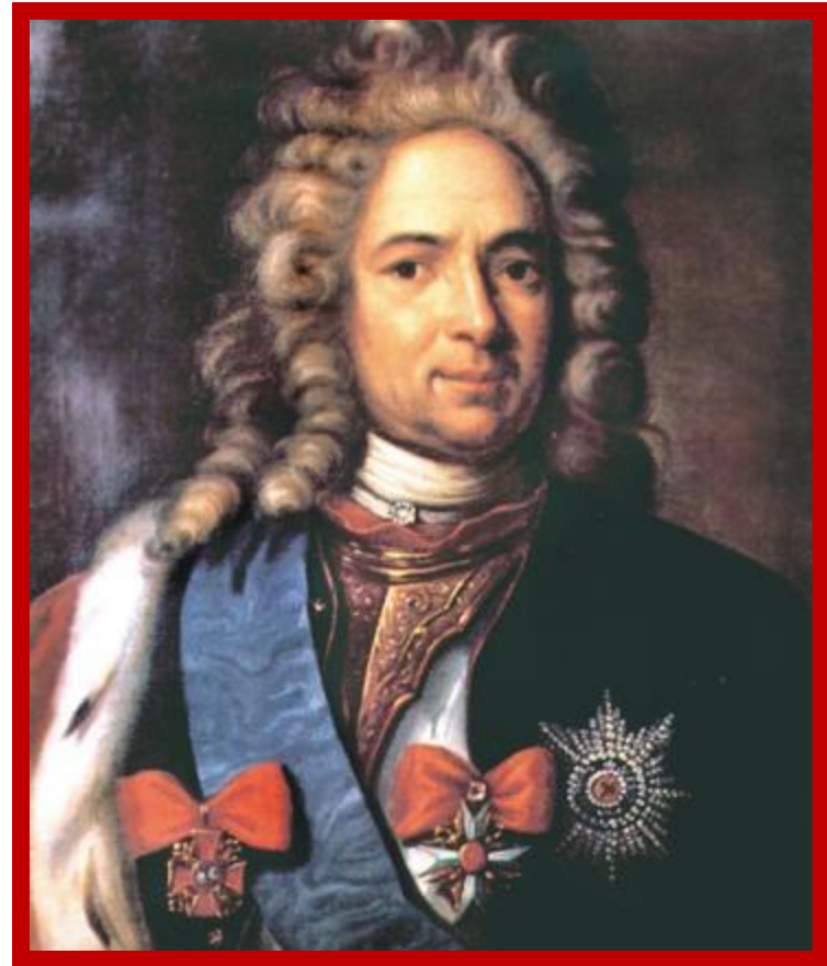
Александр Данилович Меншиков