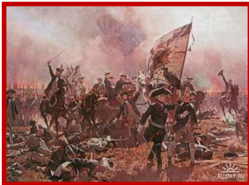
Сражение у Цорндорфа

1761 г. – смерть Елизаветы Петровны. Петр III заключил с Фридрихом II союз против своих бывших союзников и вернул Пруссии все завоевания.