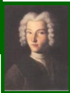
Петр II 1727-1730