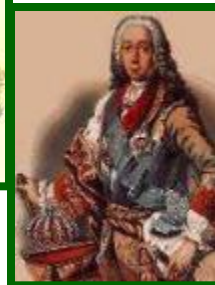
Петр III 1761-1762