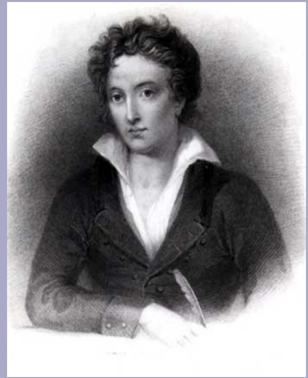
Персі Біш Шеллі