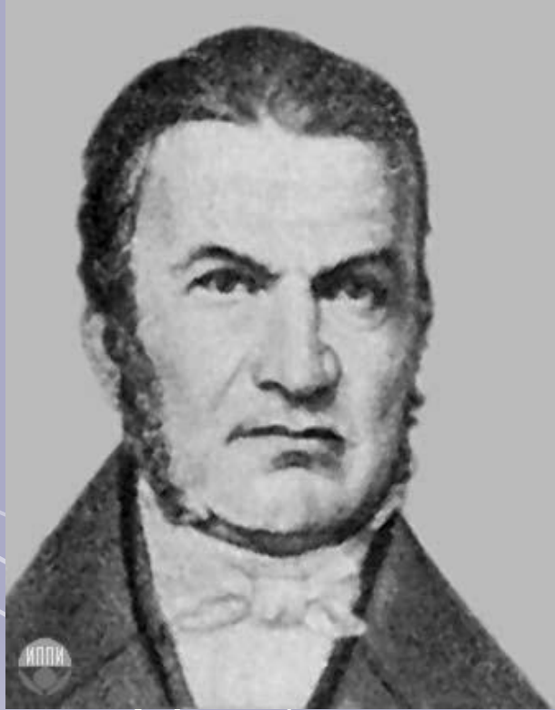
П. - Й. Шафарик