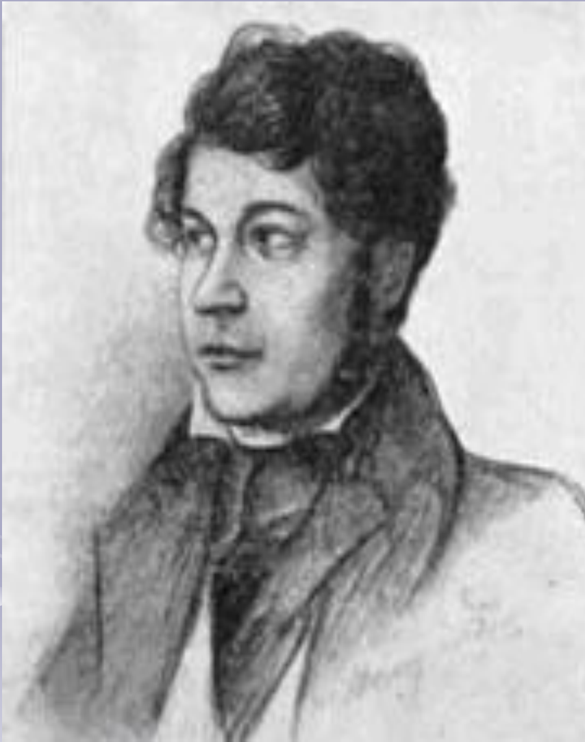
Віктор Миколайович Забіла (1808 — 1869)

Вірші почав писати в середині 30-х рр., але тільки деякі з них надруковані за життя поета.