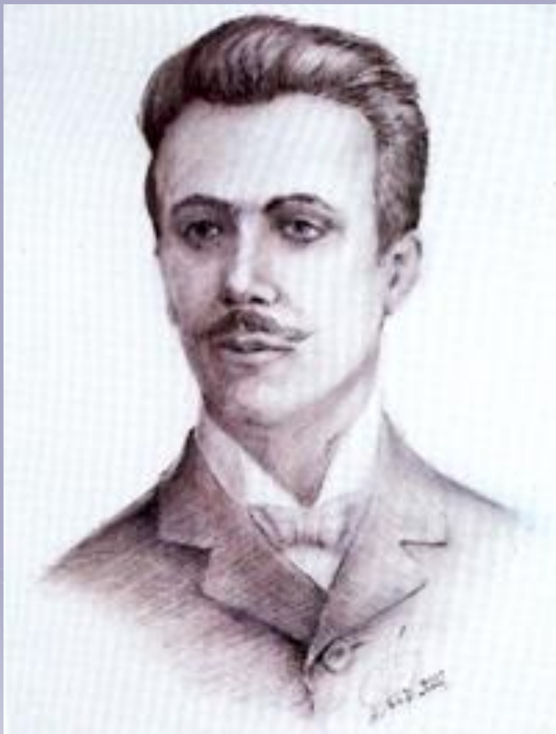
Михайло Миколайович Петренко (1817—1864)

Михайло Петренко - автор 19 поезій - збагатив нашу поезію жанром вірша-роздуму, вірша-медитації. Прославився Михайло Петренко перш за все піснею “Дивлюсь я на небо...” , яка виникла на основі його вірша “Недоля” (1840). пісня швидко стала популярною в усіх кінцях України, а потім і в світі.