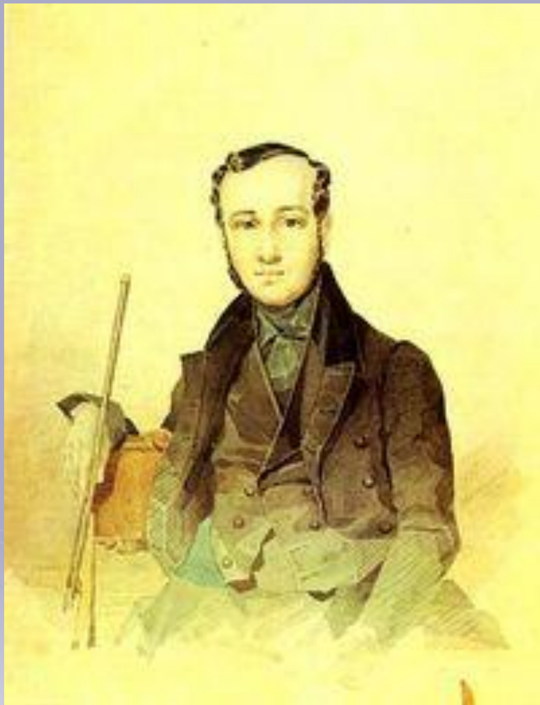
Євген Павлович Гребінка (1812 — 1848)

За його участю в 1841р. виходить альманах “Ластівка” , на сторінках якого були опубліковані твори Шевченка, Котляревського, Квітки-Основ'яненка, Боровиковського, Забіли та інших авторів. Гребінці належить також кілька українських ліричних поезій, що виникли на ґрунті народної творчості ( “Човен” (1833), “Українська мелодія”, “Заквітчалася дівчина...”, “Маруся” та ін. ). Найвизначніше місце в художньому доробку Гребінки українською мовою посідають байки.