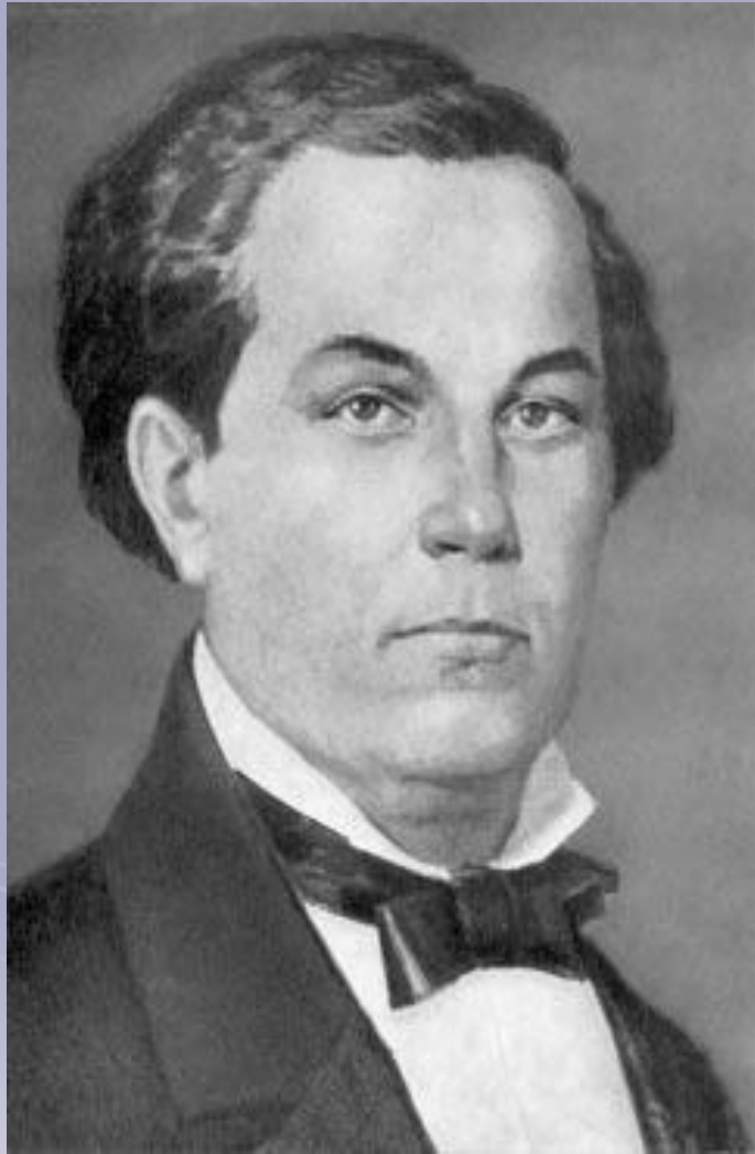
Петро Петрович Гулак-Артемовський (1790 — 1865)

1827р. — виступ на сторінках “Вестника Европы” із “малоросійськими баладами” “Твардовський” і “Рибалка. “Твардовський” — це вільна переробка гумористичної балади А. Міцкевича “Пані Твардовська”, основу якої становить досить популярна у слов'янському фольклорі легенда про гуввісу-шляхтича, що запродав душу чортові. “Рибалка” — переспів однойменної балади Гете (ще раніше її переклав російською мовою Жуковський) — має вже виразно романтичний характер.