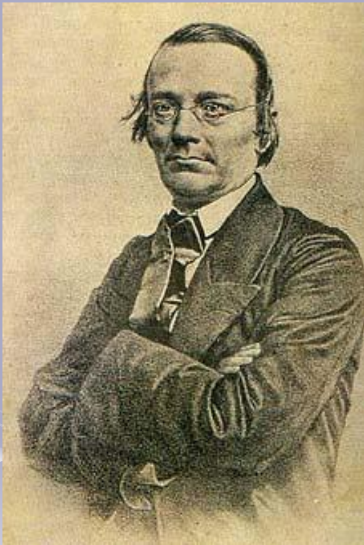
Микола Іванович Костомаров (1817 — 1885)

В історію української літератури Костомаров увійшов як письменник-романтик: віршові збірки «Украинские баллады» (1839), «Вітка» (1840), історичні п'єси.