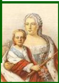
Иван VI Антонович и Анна Леопольдовна 1740-1741