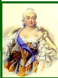
Елизавета Петровна 1741-1761