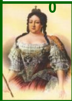
Анна Иоаннов на 1730-1740