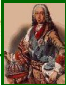
Петр III 1761-1762