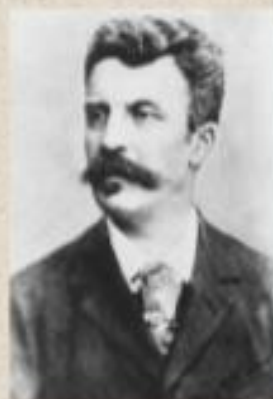
Г. де Мопассан