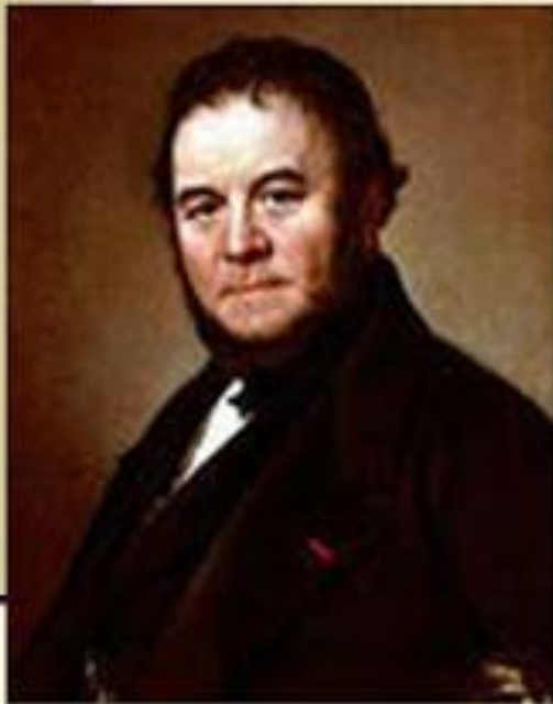
Стендаль (Мари-Анри Бейль)

Центрами розвитку реалізму в світовій літературі XIX століття стали Франція, Англія і Росія.