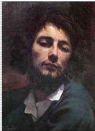
Г. Курбе, живописець

Літературний напрям, який характеризується правдивим і всебічним відображенням дійсності на основі типізації життєвих явищ.