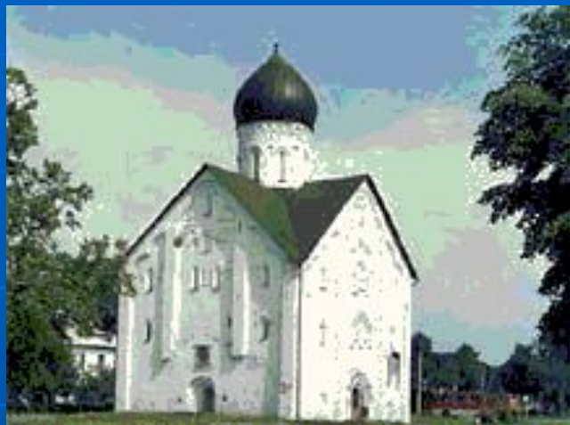
Церковь Спаса Преображения На Ильине