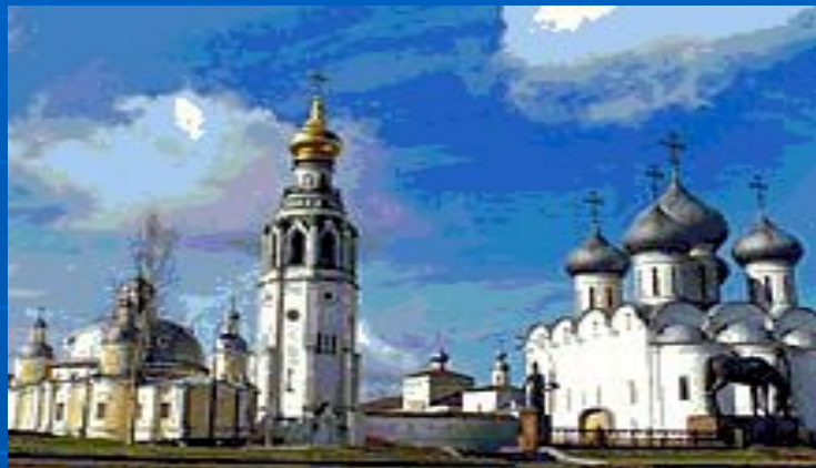
Спасо - Прилуцкий монастырь