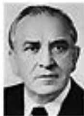
Владимир Семичастный 1903-1982