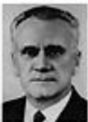
Леонид Брежнев 1906-1982