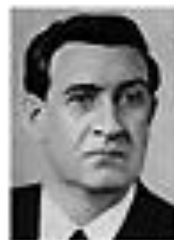
Владимир Семичастный 1903-1982