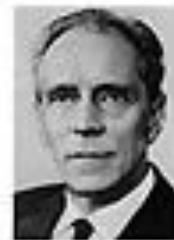
Леонид Брежнев 1906-1982