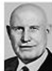
Леонид Брежнев 1906-1982

Политбюро Центрального комитета КПСС времен «застоя»