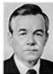
Леонид Брежнев 1906-1982