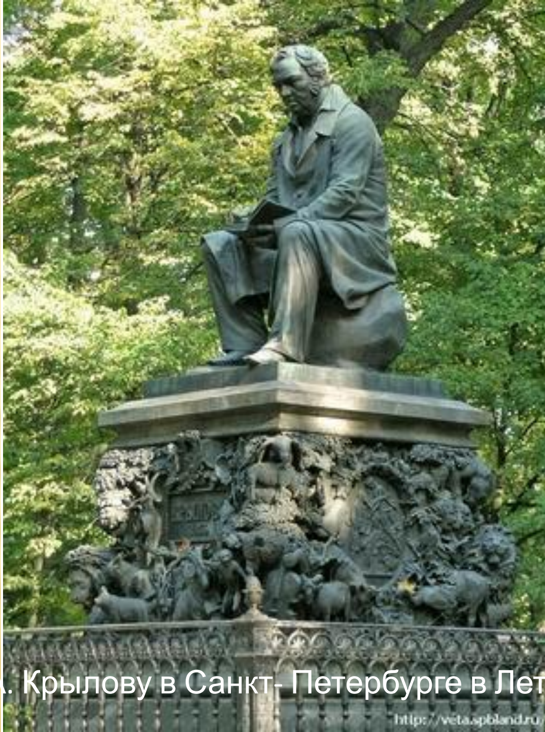
Памятник И.А. Крылову в Санкт-Петербурге в Летнем Саду