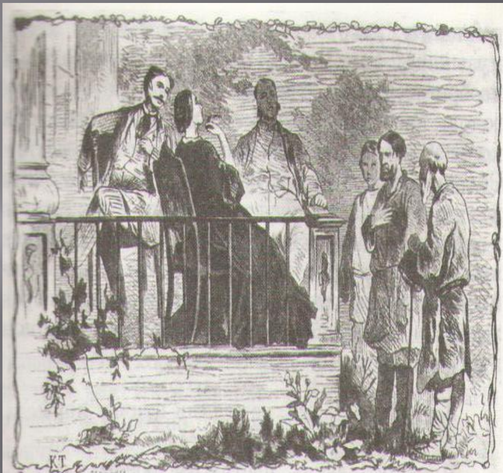
«Листы и Корни».

Гравюра по рисунку художника К. Трутовского. 1864 г.