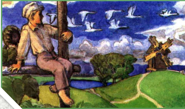
Михайло Стельмах «Гуси-лебеді летять...»

твором «Гуси-лебеді летять...» М. Стельмаха )