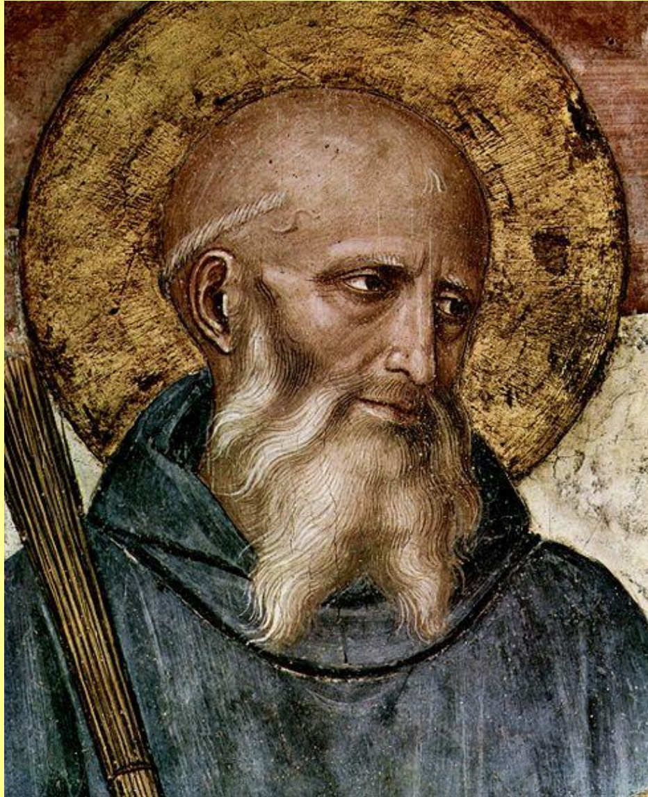
Фра Анджелико, Св. Бенедикт Нурсийский, фреска монастыря Св.Марка, Флоренция