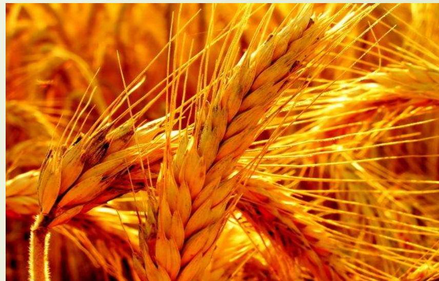
Рожь(она)- ж. р.