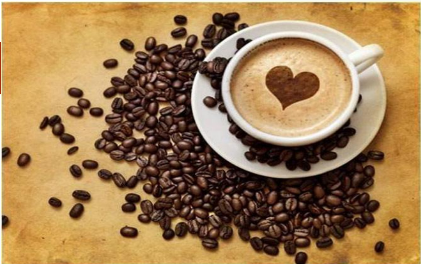
Кофе(он)- м. р.