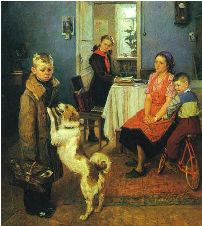
Ф.П. Решетников. "Опять двойка"

Составьте три словосочетания по картине, употребляя в каждом из них глагол с частицей НЕ. Запишите их.