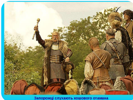
Запорозці слухають кошового отамана звнвожітї снлхуютїр кошового отамана