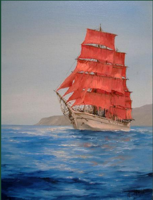
Александр Грин «Алые паруса»