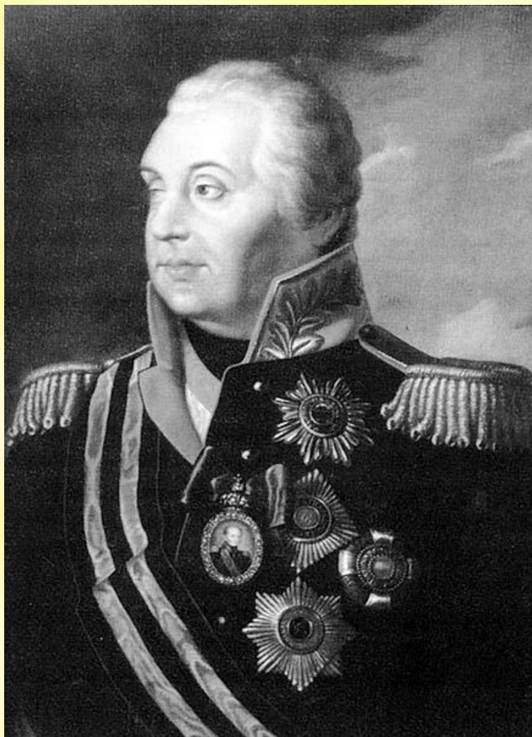
Кутузов - Ловчий