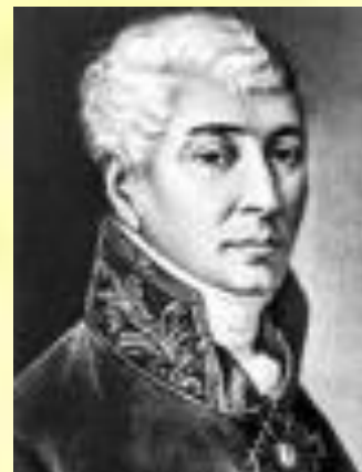
Иван Иванович Дмитриев