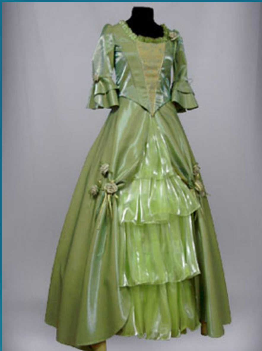
Старое платье - ...