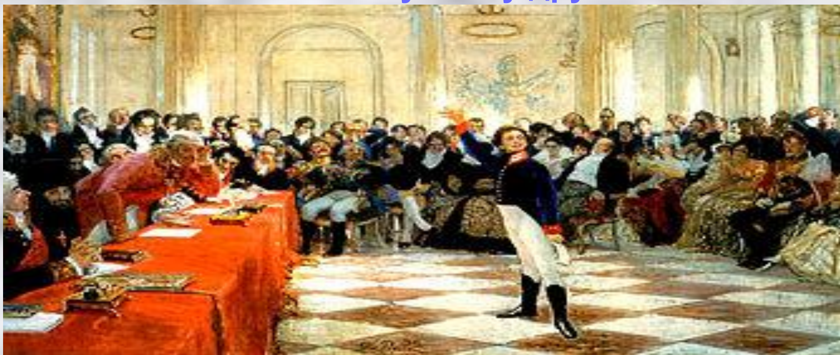
«Экзамен в лицее» картина Репина 1911г

Здесь юный поэт пережил события Отечественной войны 1812 г. Вспомним имена друзей, которых Пушкин нашел в Лицее: Иван Пущин, Вильгельм Кюхельбекер, Антон Дельвиг. Они навсегда остались верными и близкими Пушкину друзьями.