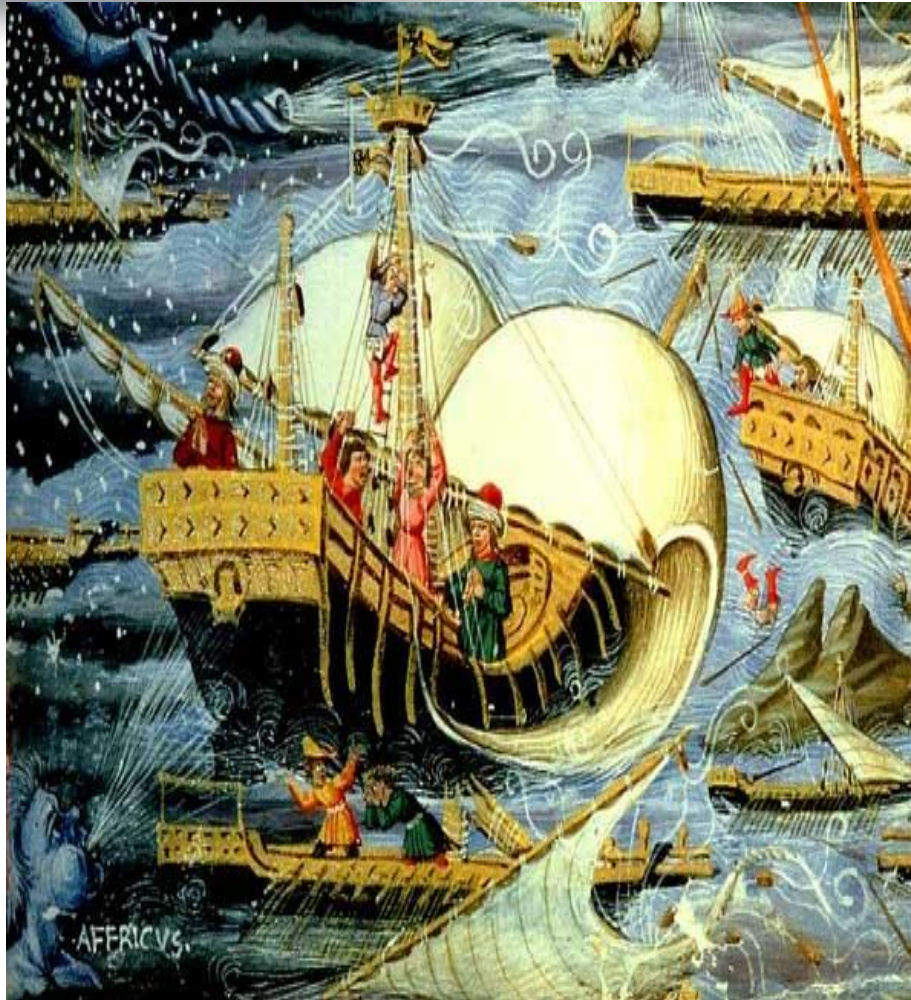
Мандри Енея від Трої до Італії

На минулому уроці відбулося наше загальне знайомство з розвитком літератури та культури у Давньому Римі, а також з однією із найдорогоцінніших перлин «золотої доби» Августа - поемою Публія Вергілія Марона «Енеїда».