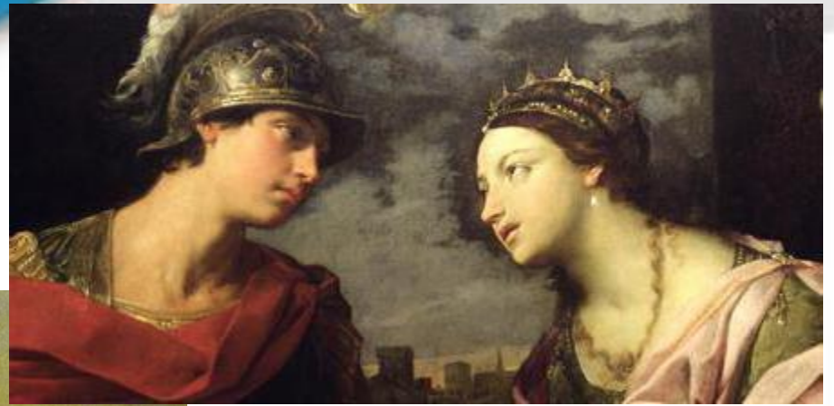
Еней і Дідона