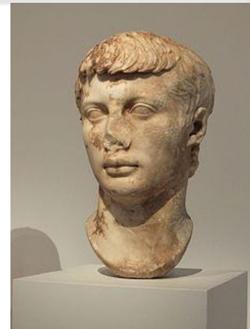
Марцелл, племінник, зять Августа