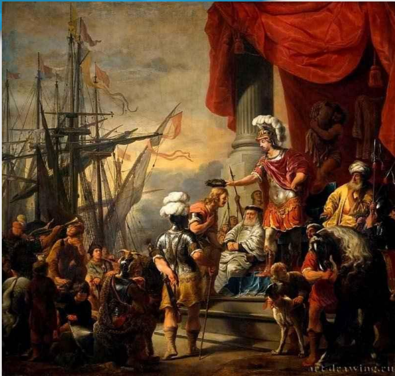
Ф. Бол. Еней при дворі царя Латина 1661-1663