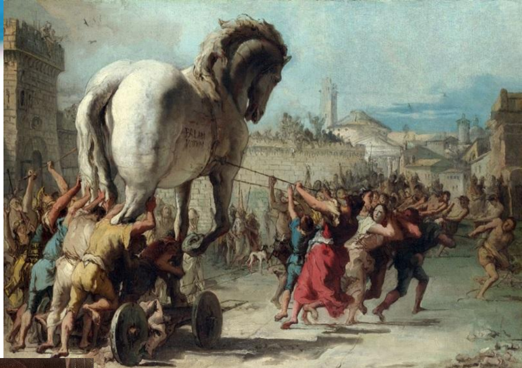
Доменіко Джованні “Троянський кінь”