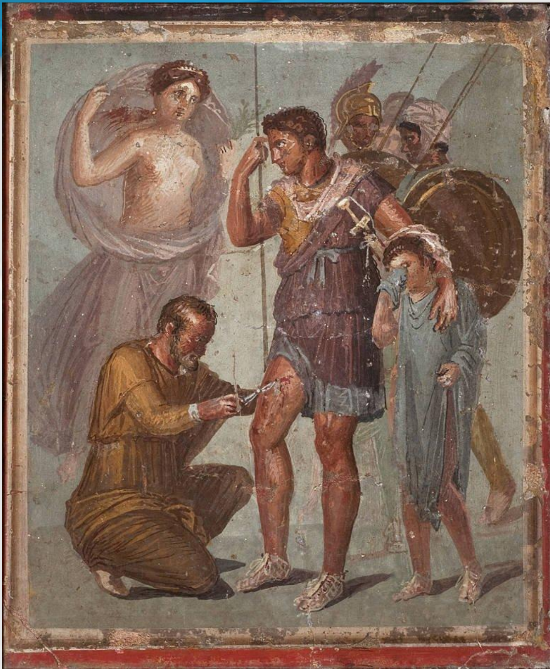
Поранений Еней. Фреска. Помпеї