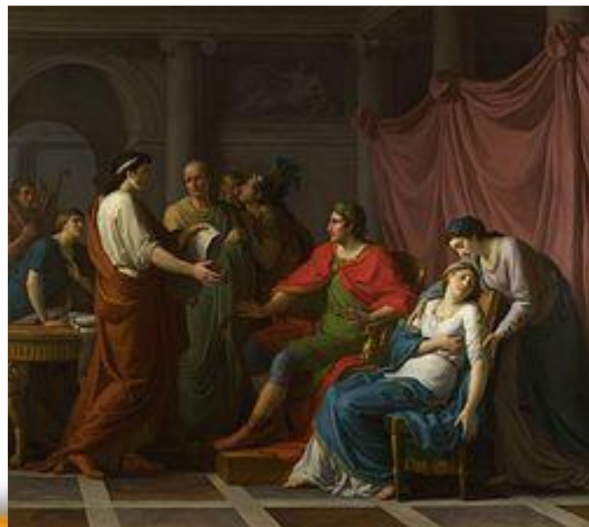
Ж.-Ж. Тайлассон. Вергілій читає “Енеїду” Августу і Октавії. 1787