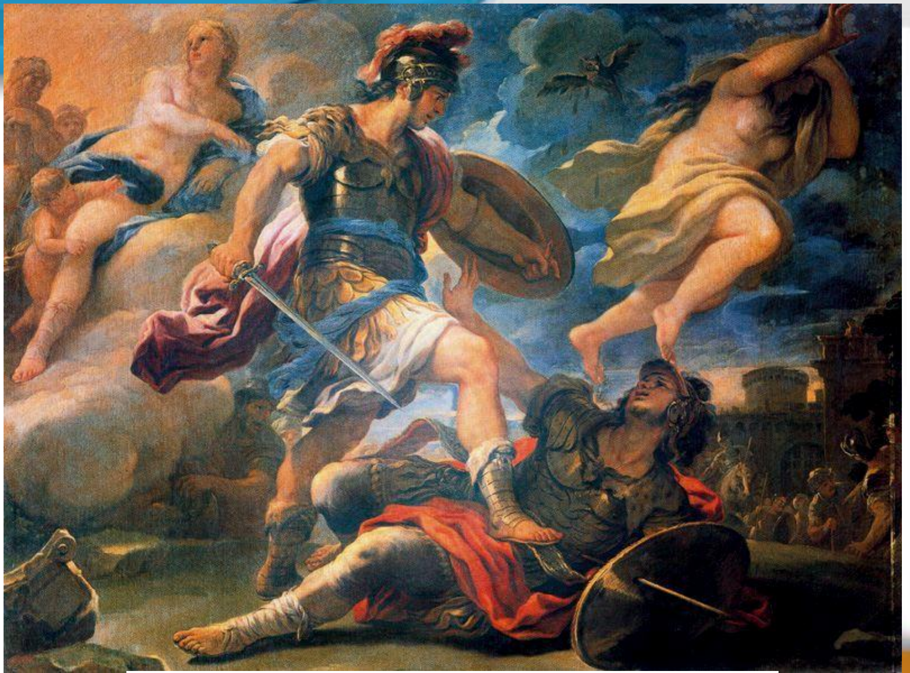
Luca Giordano (1634–1705) Еней перемагає Турна