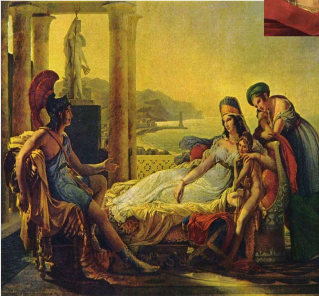
Пьер – Нарсис Герен “Еней розповідає Дідоні про загибель Трої”