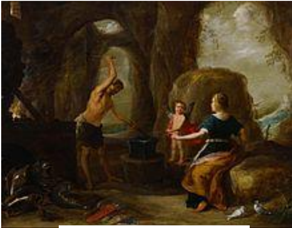
Вулкан кує зброю для героя

Книга восьма. Турн піднімає на війну людей землі Лації і посилає в Аргіріпу просити допомоги в Діомеда. З другого боку, бог річки Тибру Тиберін уві сні спонукає Енея укласти угоду з аркадським царем Евандром, що заснував на Палатинському пагорбі місто Паллантей. Евандр гостинно приймає Енея, обіцяє йому допомогу, запрошує взяти участь у святкуванні на честь Геркулеса, знайомить його з околицями. Тим часом Вулкан, чоловік Венери, на її прохання кує зброю для героя. Евандр пропонує Енеєві очолити етрусків, які щойно прогнали свого царя Мезенція, і дає йому чотириста вершників під проводом свого сина Палланта. Еней приймає від Венери викуту для нього зброю і милується щитом, на якому зображено майбутні подвиги і долю римлян.