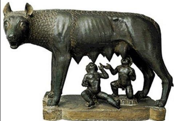
Ромул і Рем – сини Марса і весталки Реї Сільвії