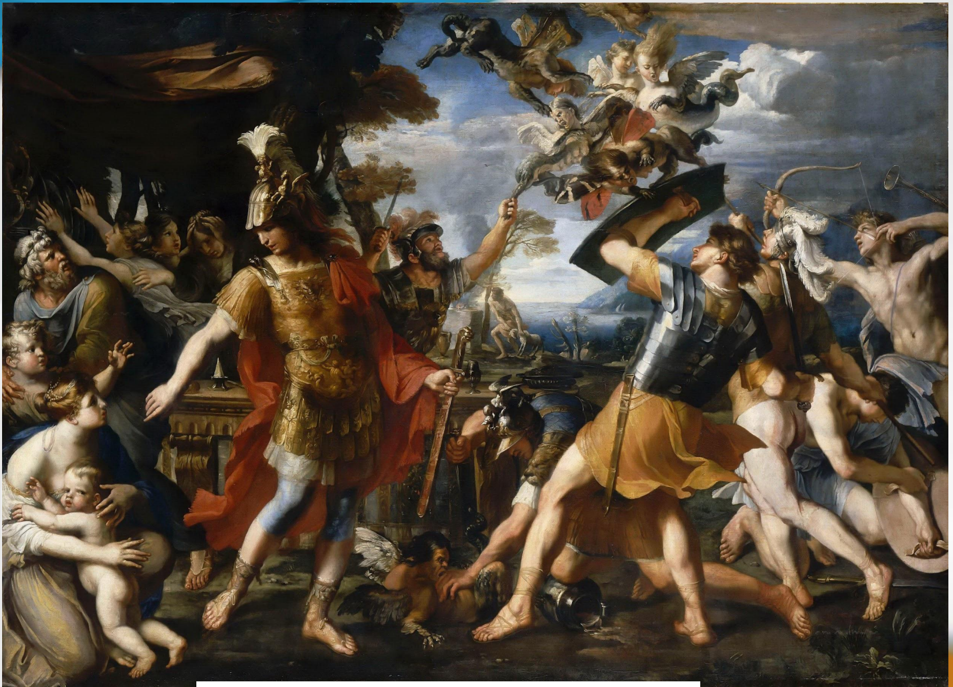
Франсуа Пер'є. Битва Енея з гарпіями