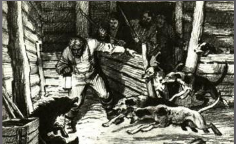
Иллюстрация А. Лаптева к басне И. А. Крылова "Волк на псарне"

это троп, который заключается иносказании; выражении отвлеченного понятия посредством образа; связь между понятием (идеей) и образом устанавливается по сходству.