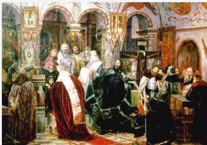
Лишение Никона на Соборе Патриаршего сана. Неизвестный художник.