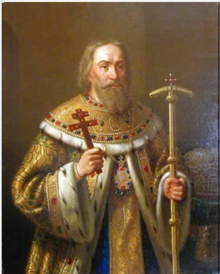
Н. Тютрюмов. Портрет патриарха Филарета.

Церковь, как и остальное население, разделилось на две части: