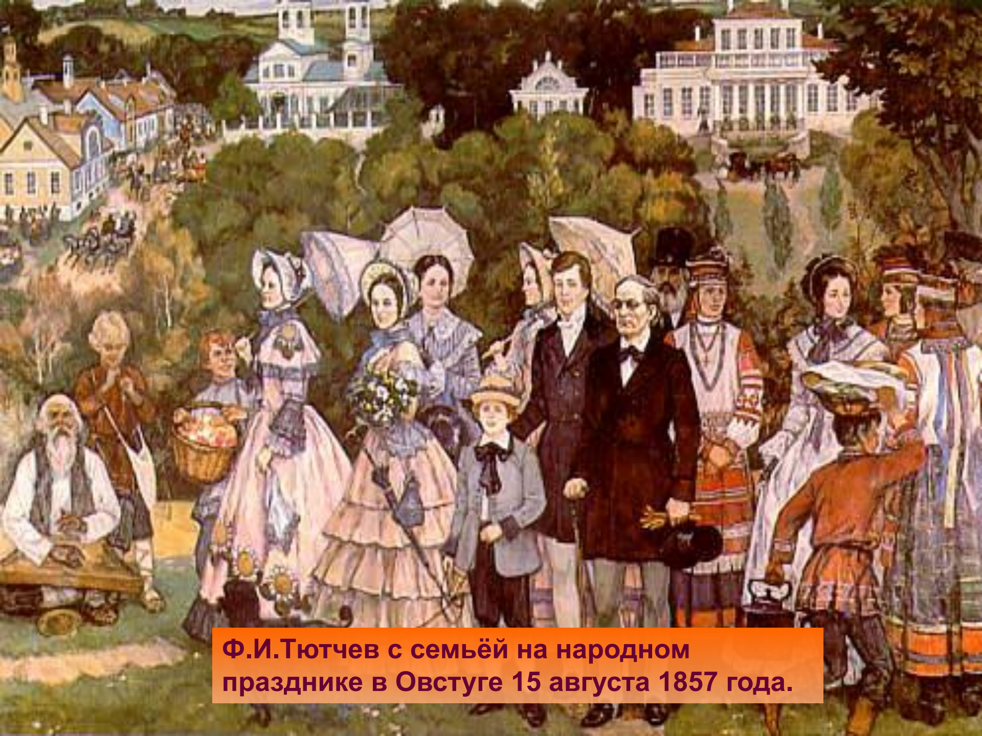
Ф.И.Тютчев с семьёй на народном празднике в Овстуге 15 августа 1857 года.