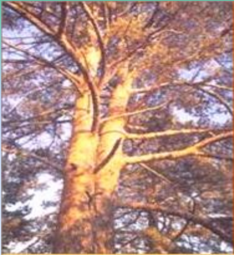
Иллюстрация к эпизоду «Ель и сосна.»

Чем отличается иллюстрация от художественного описания, данного М.М. Пришвиным в повести?