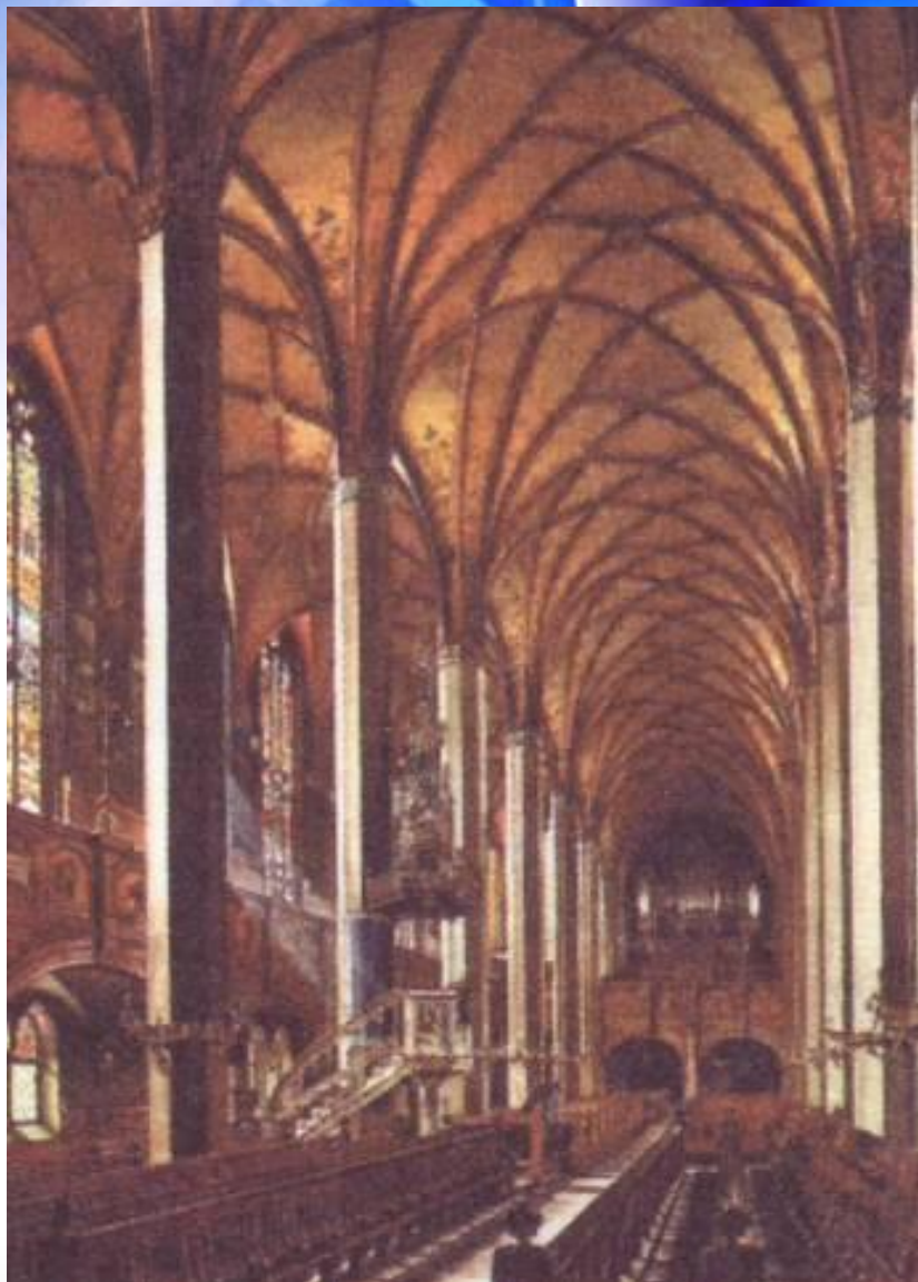
Церковь Св. Фомы в Лейпциге, где работал И.С.Бах