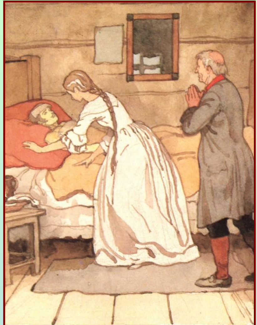
Марья Ивановна подошла к моей кровати и наклонилась ко мне.

14) А что увлекает нас в истории любви Маши и Гринева?