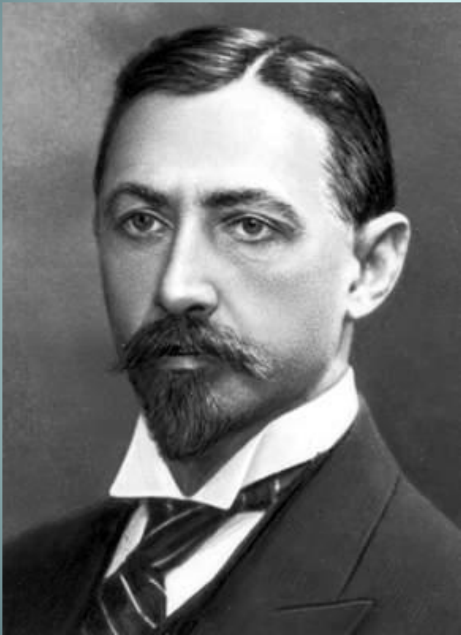
Иван Алексеевич Бунин (1870-1953)