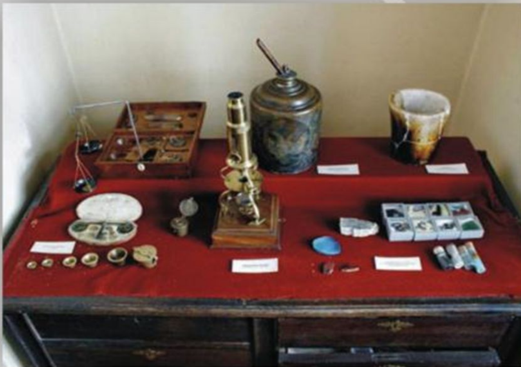
Стол химика. Экспонаты химической лаборатории М.В. Ломносова.

ПРИГОТОВЛЕНИЕ СМАЛТ ХРАНИЛОСЬ В СТРОГОЙ ТАЙНЕ ИТАЛЬЯНСКИМИ МАСТЕРАМИ. ЛОМОНОСОВА-ХИМИКА ПРИВЛЕКАЛА К СЕБЕ ЗАДАЧА РАСКРЫТЬ ЭТОТ СЕКРЕТ И САМОСТОЯТЕЛЬНО РАЗРАБОТАТЬ РЕЦЕПТУРУ ДЛЯ ПОЛУЧЕНИЯ СМАЛТ.