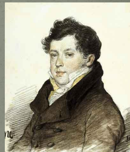
И. С. Тургенев