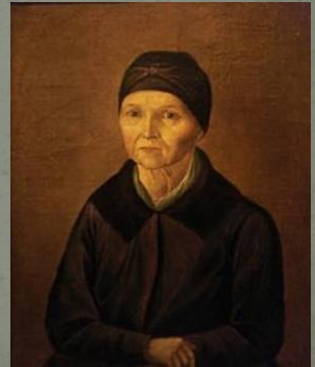
М.А. Ганнибал и Арина Родионовна