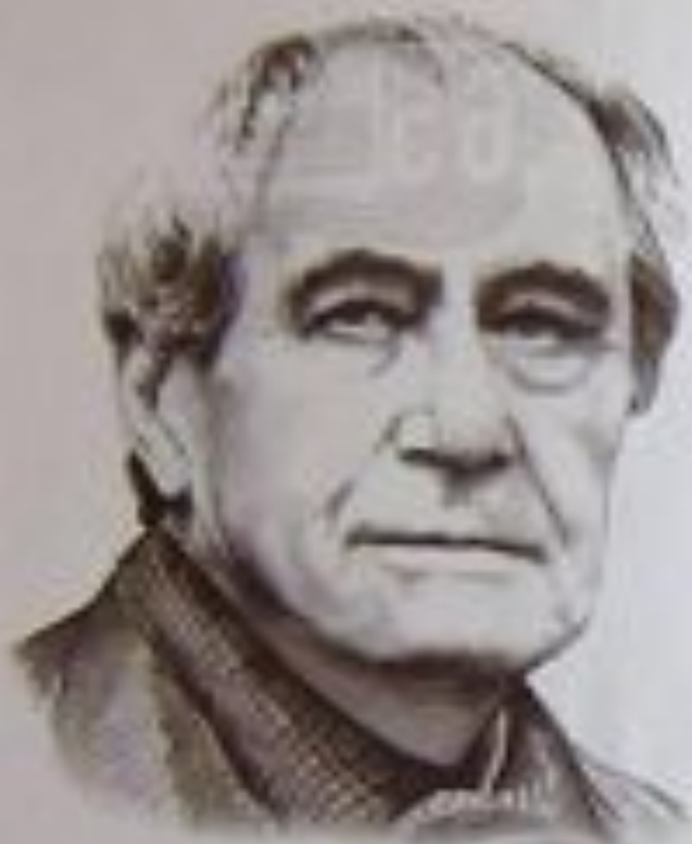
КАТАЕВ Валентин Петрович 1897–1986

Замечательный русский писатель Валентин Петрович Катаев – автор многих произведений для детей.