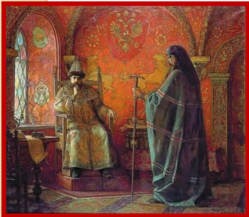
"Царь Алексей Михайлович и Патриарх Никон"

1658 год – Никон удалился в Воскресенский Новоиерусалимский монастырь