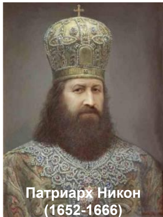
Патриарх Никон (1652-1666)