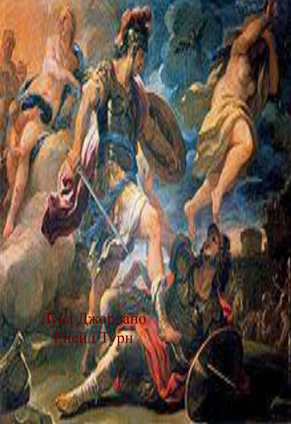
Лука Джордано Еней і Турн