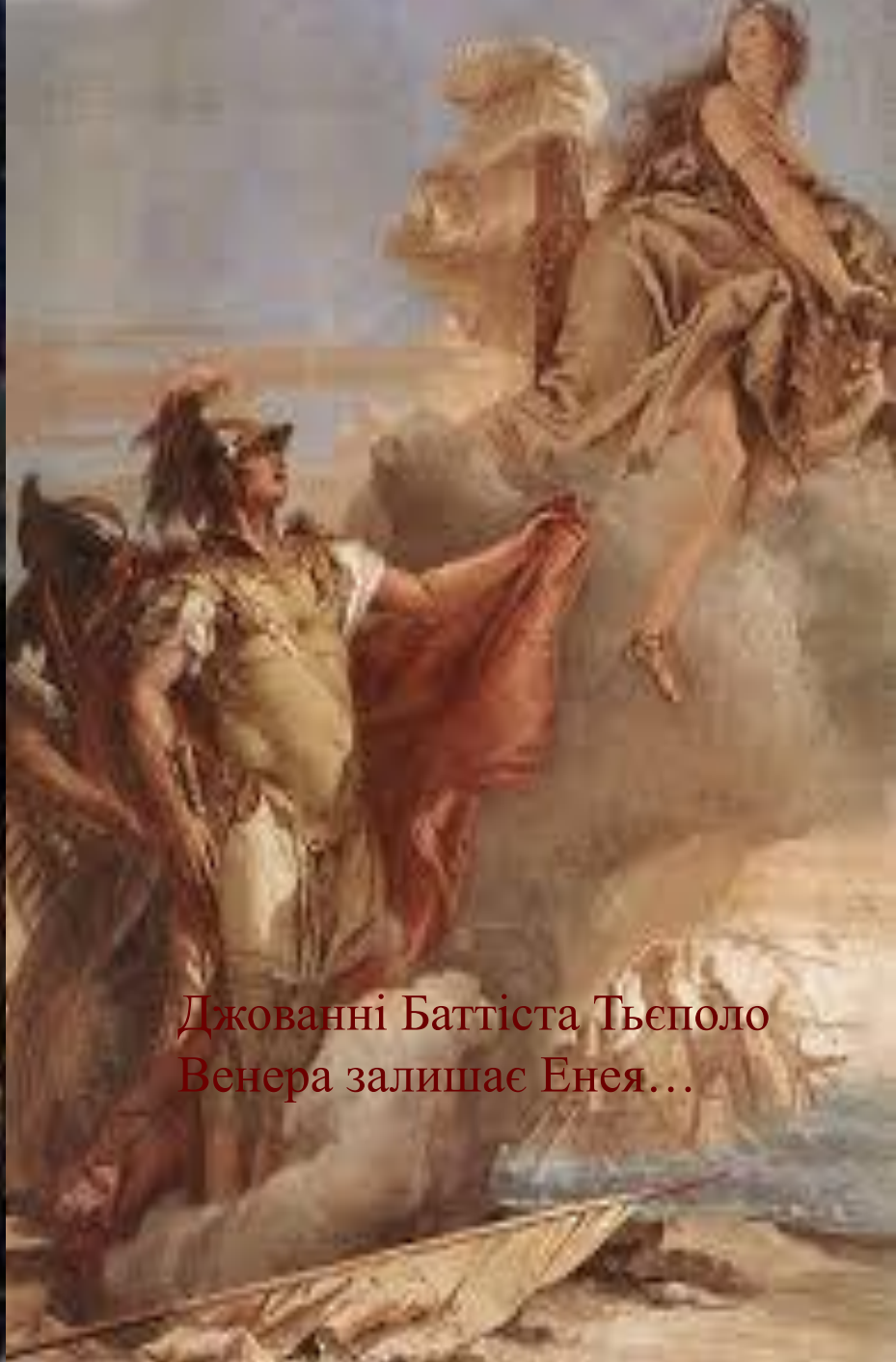
Джованні Баттіста Тьєполо Венера залишає Енея...