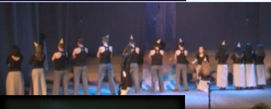
ДПП «Черта» ВСГИК