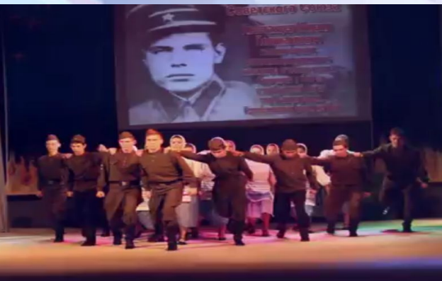
Отчетный концерт «МККиИ» военный

«Метафорическая мизансцена требует особо тщательной разработки пластических движений и словесного действия для создания обобщенного художественного образа режиссерской мысли».