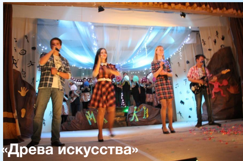
Театрализованное представление «Древа искусства»