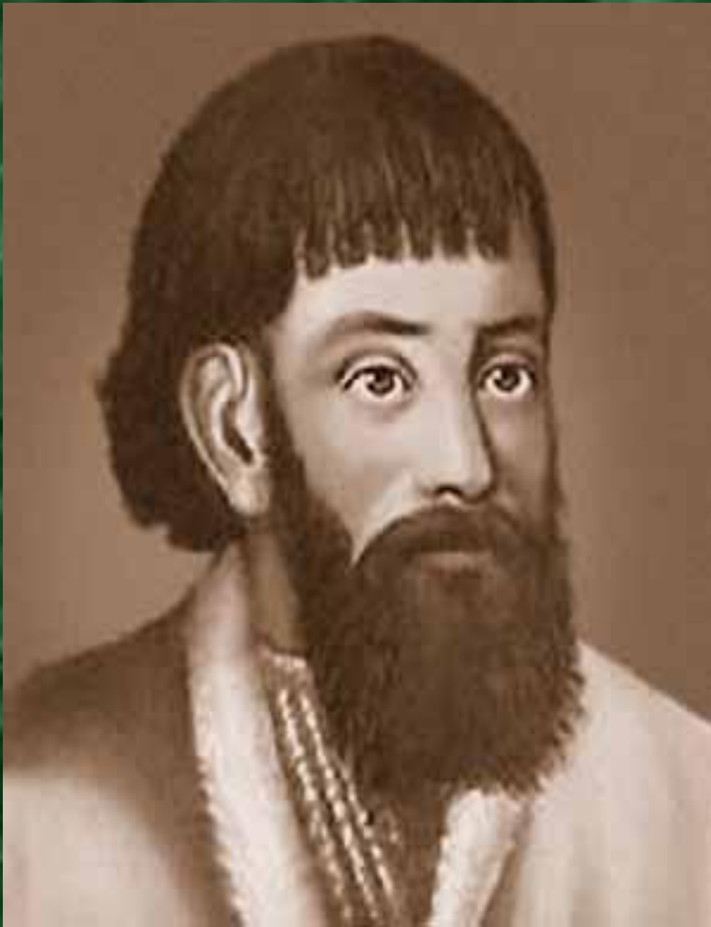
Портрет Емельяна Ивановича Пугачёва