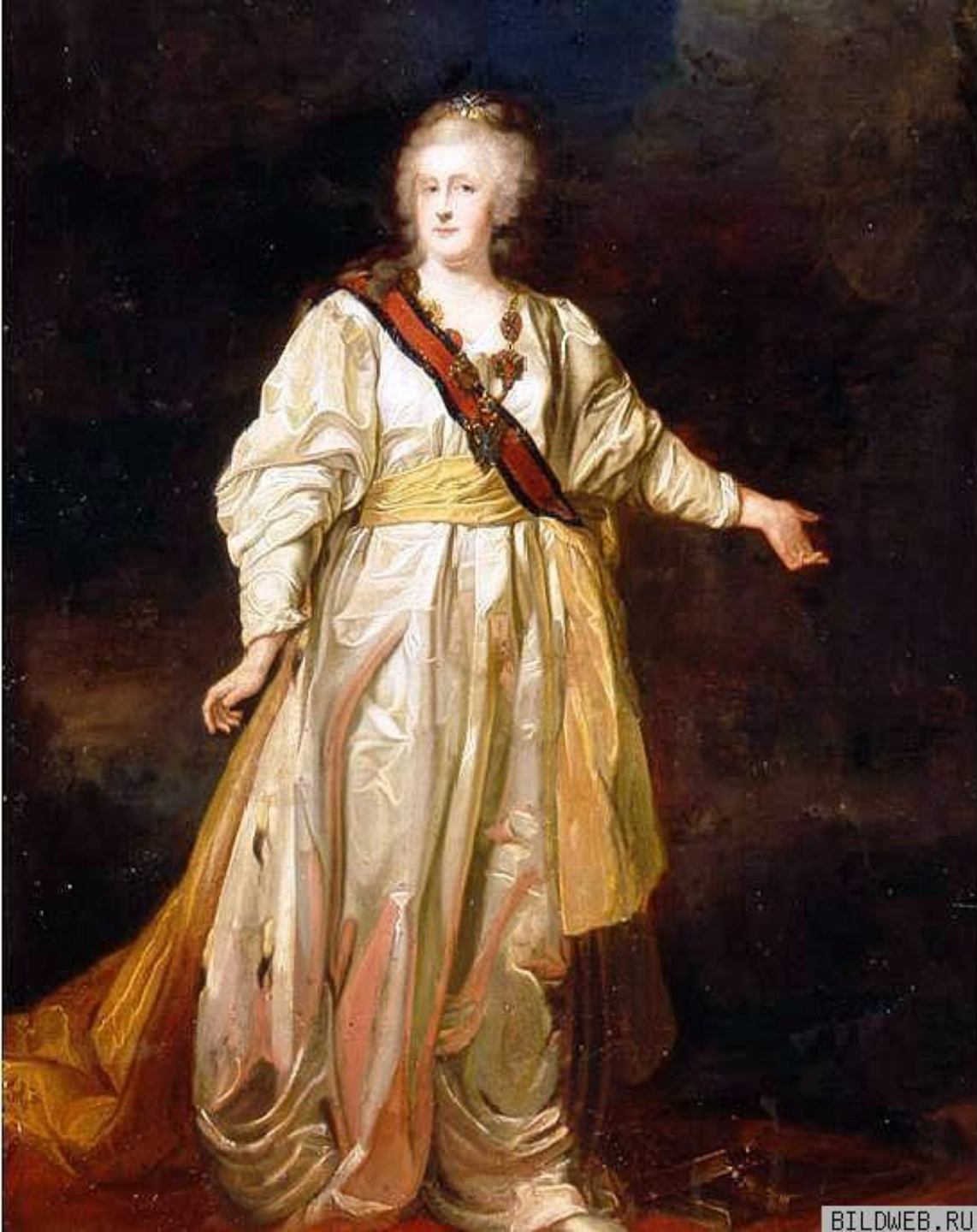
Портрет императрицы Екатерины II.