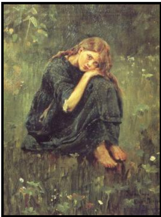
Этюд к картине Виктора Васнецова «Алёнушка»

В живописи этюд – это небольшая работа, выполненная с натуры, в музыке – упражнение, нацеленное на развитие исполнительской техники и композиционного мастерства, в философии – размышление, исследование одного вопроса, узкой темы