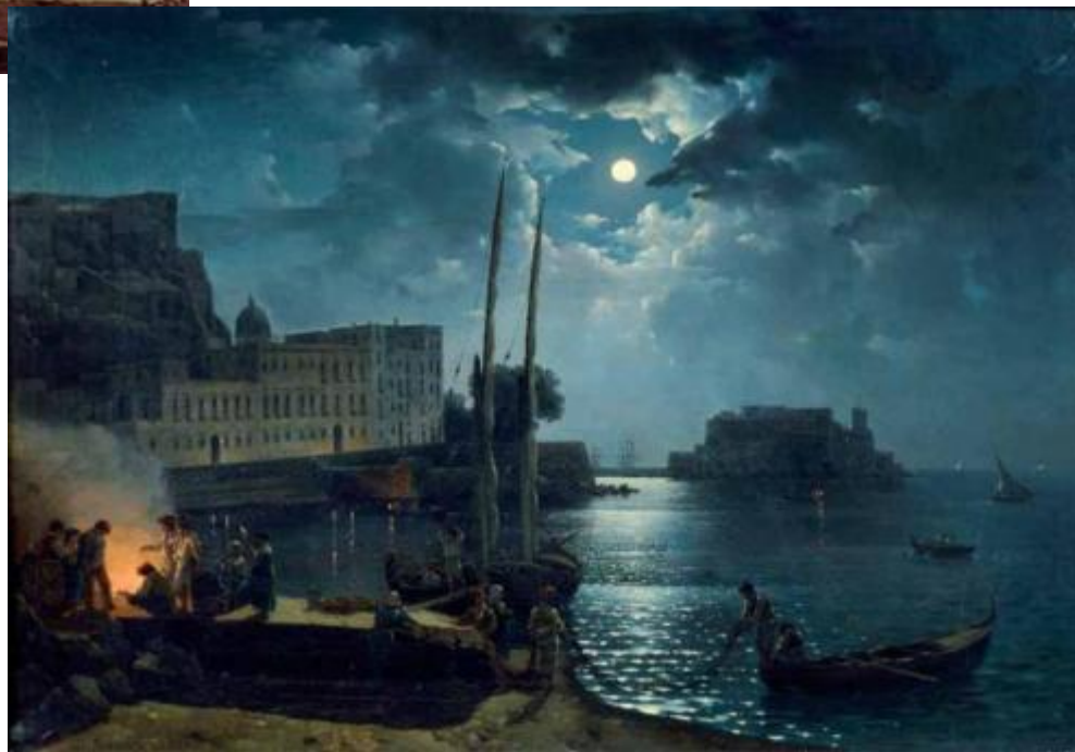
Сильвестр Щедрин «Лунная ночь в Неаполе» 1828 г.