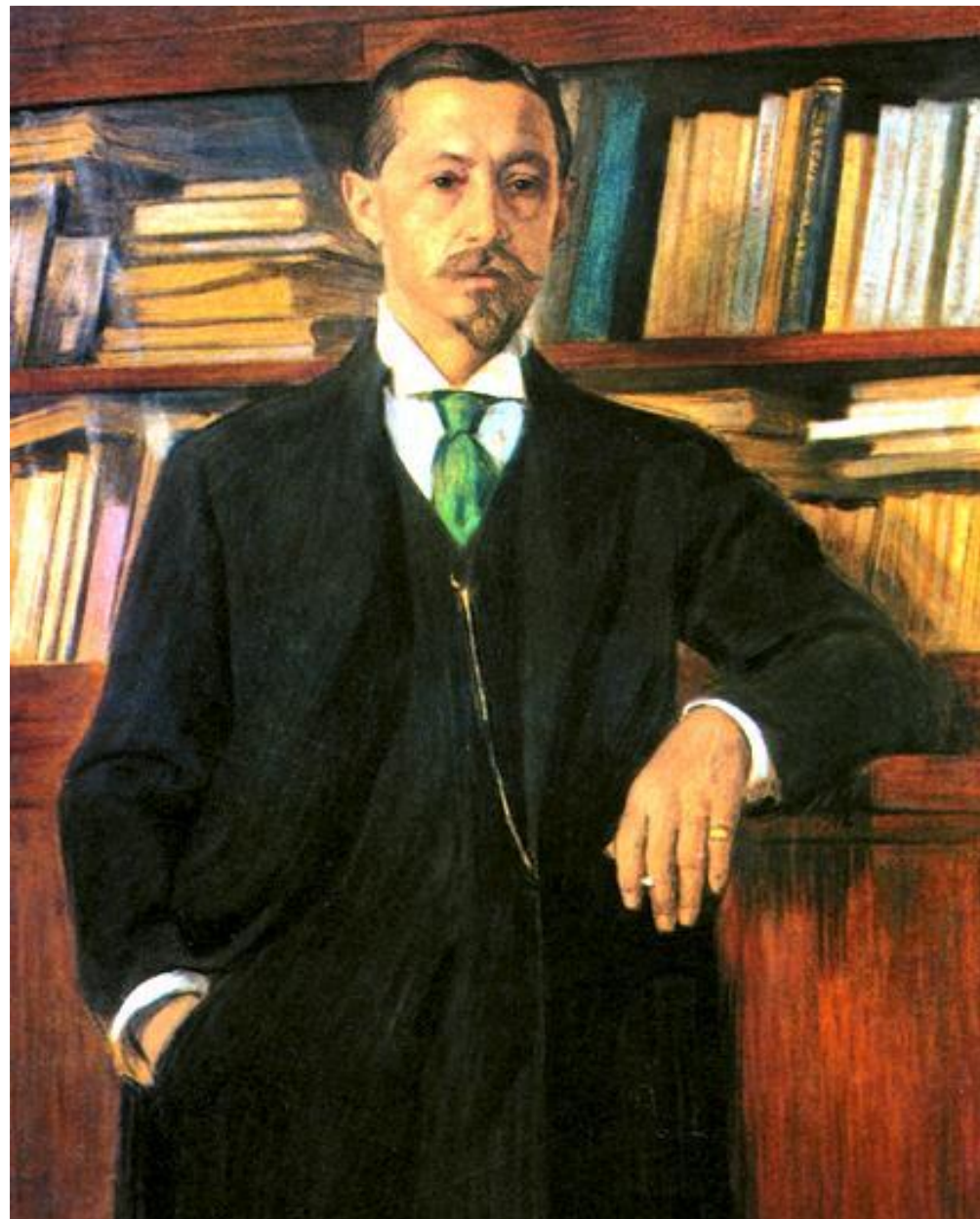
В. Россинский «Портрет И.А. Бунина»