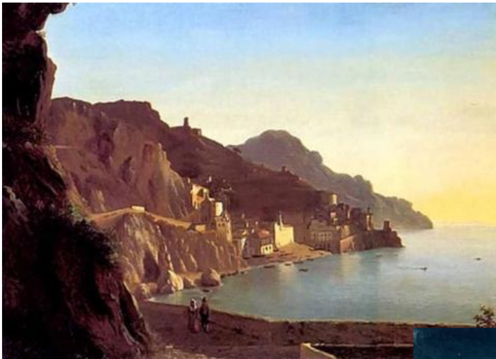
Сильвестр Щедрин «Итальянский пейзаж. Капри» 1827 г.