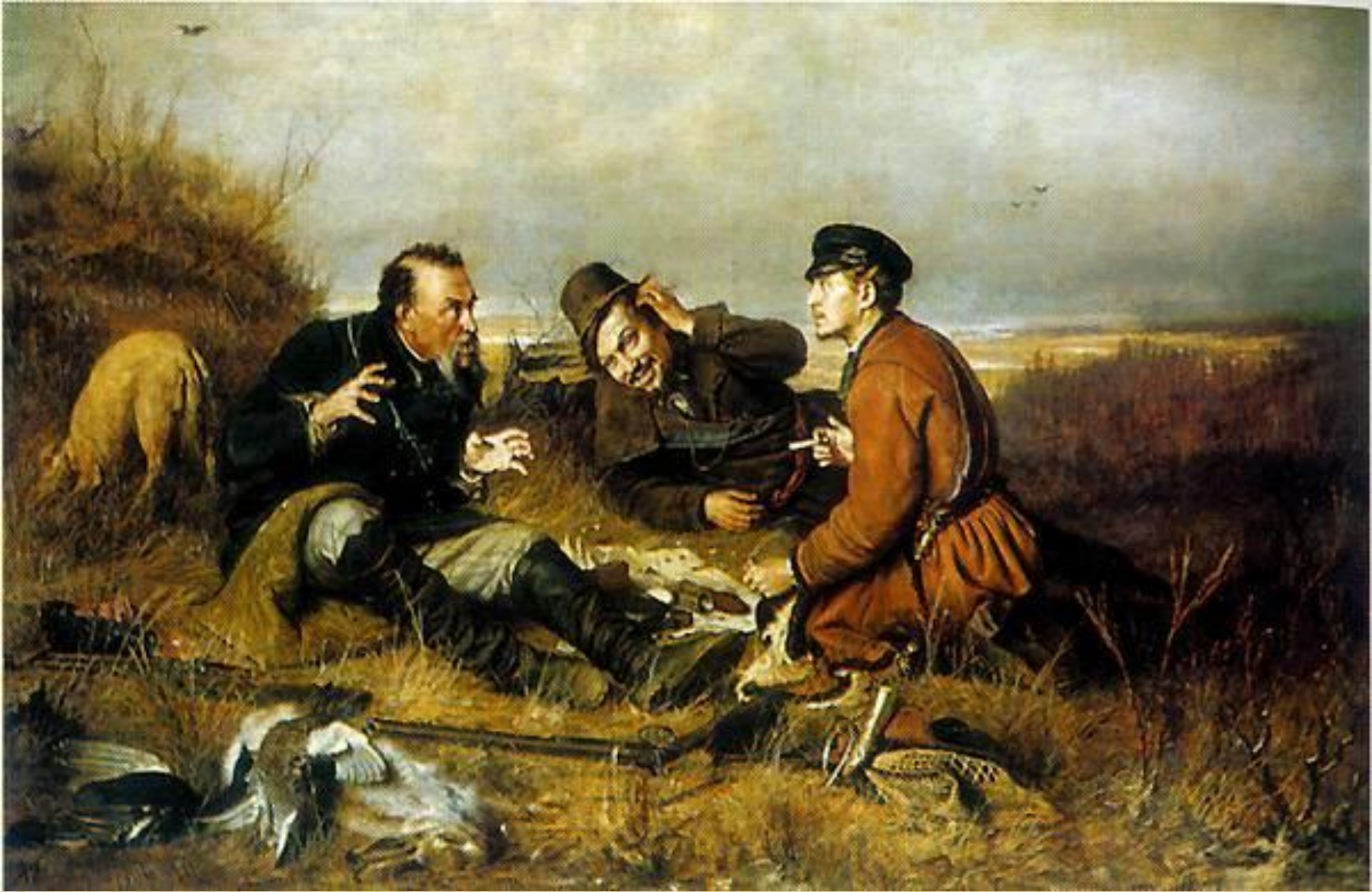
Василий Григорьевич Перов. «Охотники на привале»