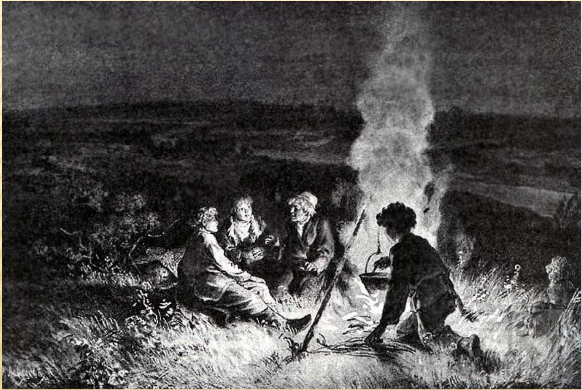
И.С.Тургенев «Бежин луг»