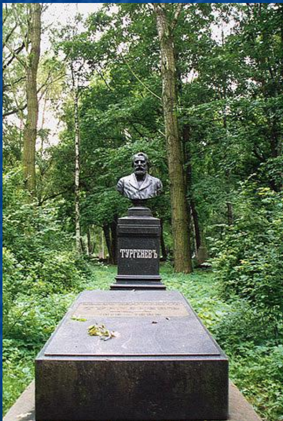
Памятник на могиле Тургенева.