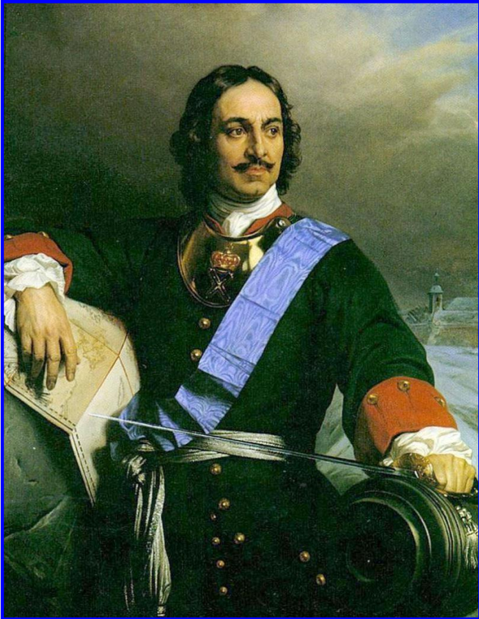
Петр I (1672-1725) – первый Российский император

Прочитайте раздел «Путешествие в прошлое»