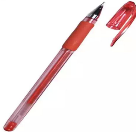
ручка ж. р.