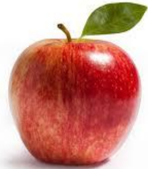
яблоко ср. р.