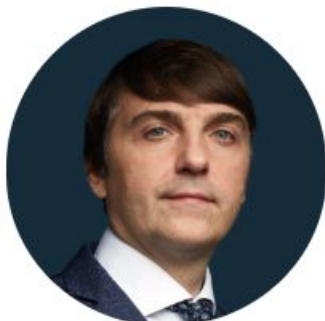
Кравцов Сергей Сергеевич

Министр просвещения Российской Федерации