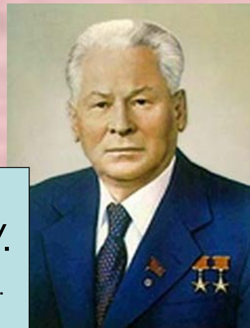
Черненко К.У. 1984-1985 гг.