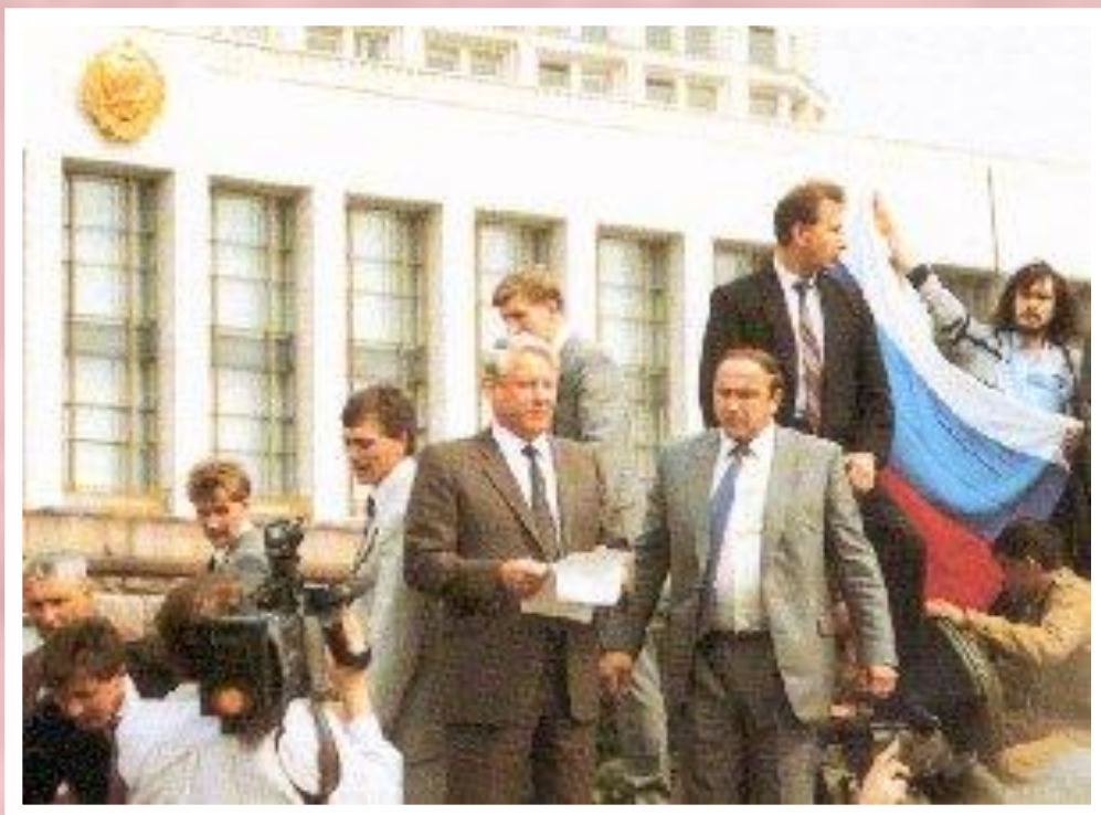
Б.Ельцин у Белого Дома. Август 1991 г

По призыву Ельцина тысячи москвичей собрались у здания Белого дома, чтобы предотвратить его штурм. 21 августа ВС РСФСР поддержал руководство республики. в тот же день Горбачев возвратился в Москву, а члены КГЧП были арестованы. 25 августа М.Горбачев собрал ВС СССР и добился от его депутатов решения о самороспуске. В конце августа все союзные республики объявили о своей полной независимости