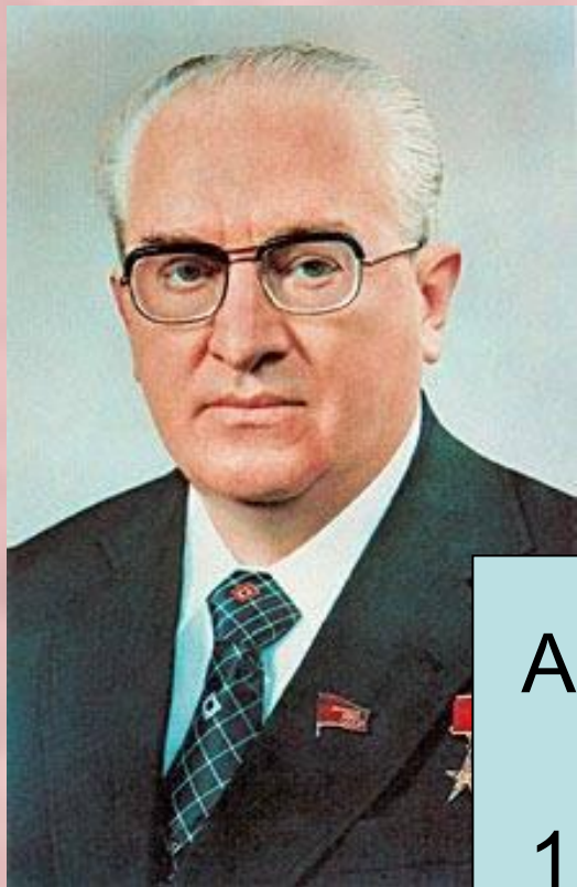
Андропов Ю. В. 1982-1984 гг.