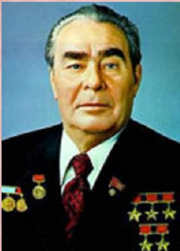
Л.И.Брежнев 1964-1982г ноябрь