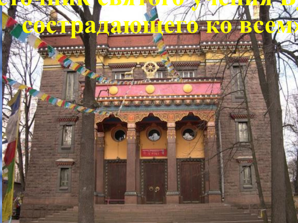
Буддийский дацан (храм)

Название этого храма в переводе с тибетского языка обозначает «источник святого учения Будды, сострадающего ко всем»